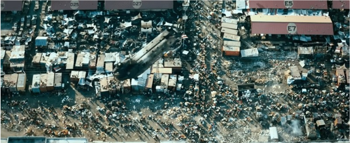
Des masses de personnes infectées sont entassées dans des camps décrépits surveillés par des hélicoptères en vol stationnaire.

Les personnes qui ne sont pas infectées vivent dans des conditions d'enfermement très contrôlées et sans fin. La technologie utilisée pour contrôler les gens est loin d'être de la "science-fiction". Nous en sommes à environ 80 % dans la vie réelle.