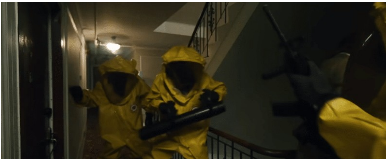
Les autorités font irruption dans une maison pour envoyer de force un citoyen dans un camp de quarantaine.

Je pense qu'il est temps de désinstaller cette application et de lui donner une mauvaise critique.