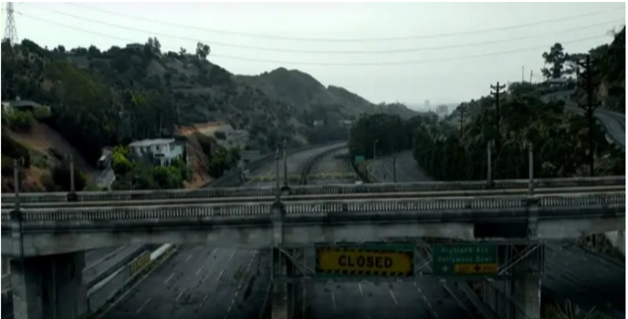
Des autoroutes entières sont fermées parce que les gens n'ont pas le droit de se déplacer.