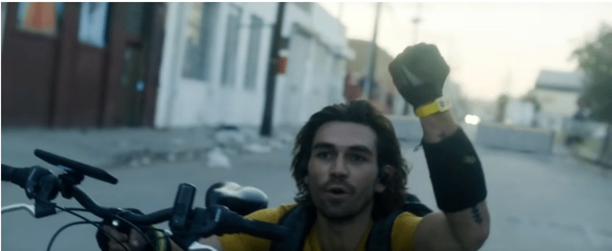
Le protagoniste du film exhibe un bracelet prouvant qu'il est immunisé contre les soldats portant des masques à gaz qui patrouillent dans les rues.

Les personnes qui ne sont pas infectées vivent dans des conditions d'enfermement très contrôlées et sans fin. La technologie utilisée pour contrôler les gens est loin d'être de la "science-fiction". Nous en sommes à environ 80 % dans la vie réelle.