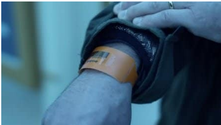
Une capture d'écran du film Contagion. Les personnes qui ont été vaccinées ont reçu des bracelets avec des codes-barres pour pouvoir entrer dans les espaces publics.

Le concept de bracelet d'immunité a déjà été présenté aux masses dans le film Contagion , déjà mentionné.