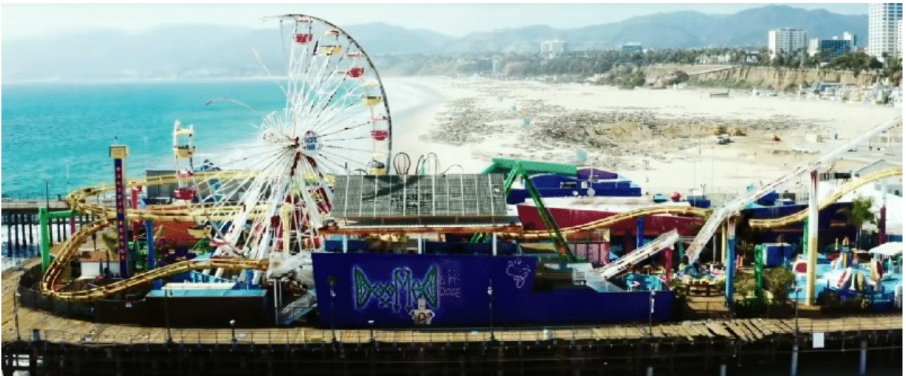
Un parc d'attractions abandonné avec les mots "condamné" peints à la bombe sur un mur. L'amusement est mort.