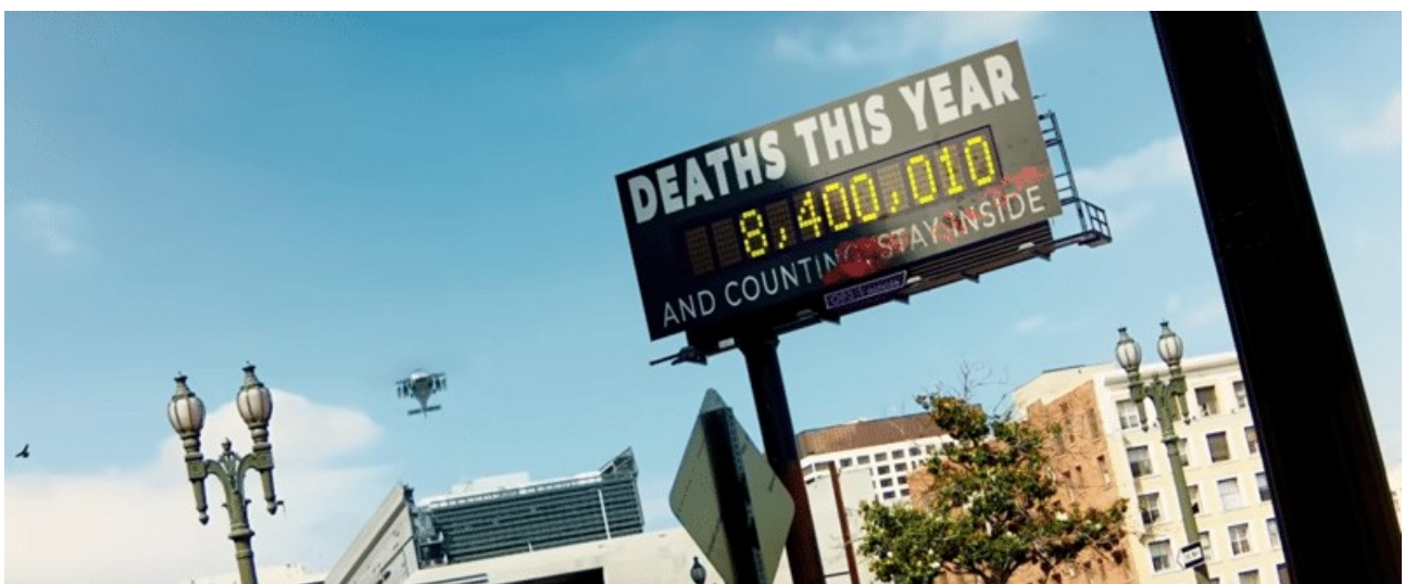
Un sinistre panneau d'affichage indiquant plus de 8 millions de morts en 2024 tout en ordonnant aux gens de rester à l'intérieur. Ce type de connerie orwellienne existe déjà en ce moment.